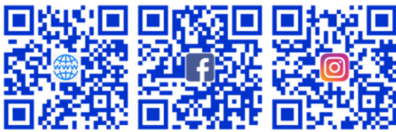
Internet Facebook Instagram

La Confrérie des amateurs du Bleu de Gex vous invite à découvrir et nous rejoindre sur les réseaux via notre site internet et nos pages Facebook et Instagram.